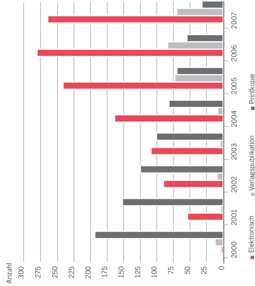
Abb. 1: Dissertationen an der Heinrich-Heine-Universität 2000–2007

Elektronische Medien in der Informationsversorgung der Universitäts- und Landesbibliothek Düsseldorf ..... 639