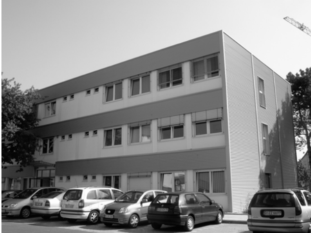
Geb. 15.16 - Büro des Behindertenbeauftragten